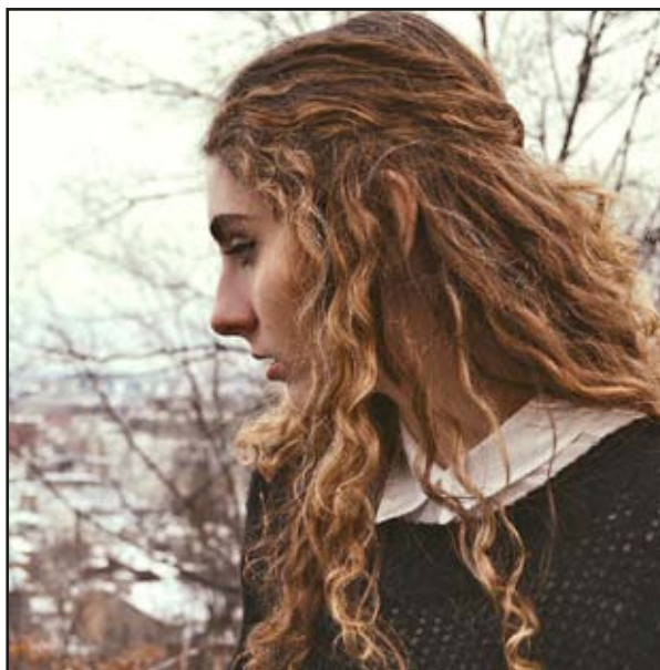
Cover del CD "Where you're from" e in sala trasmissioni a Radio CBC, Montreal