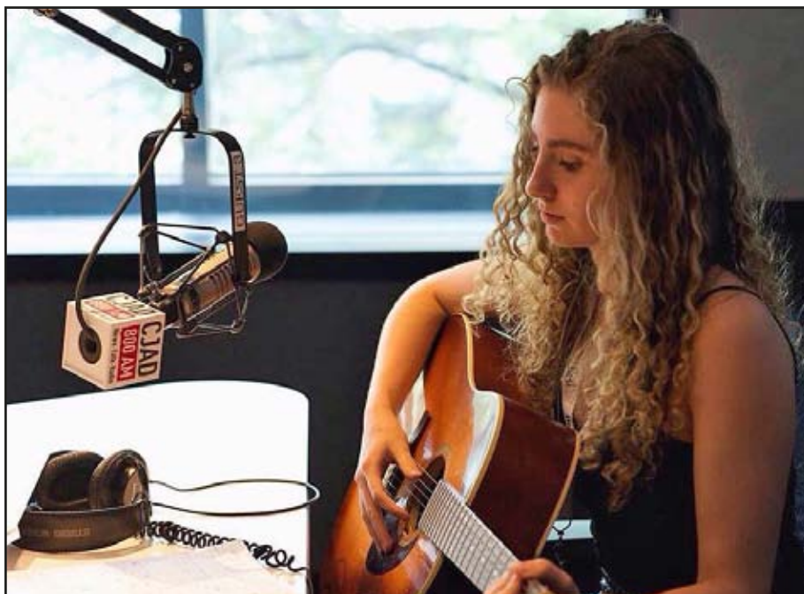
Cover of CD "Where you're from" and in the transmission room of CBC Radio in Montreal